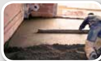
SOLERAS DE MORTERO